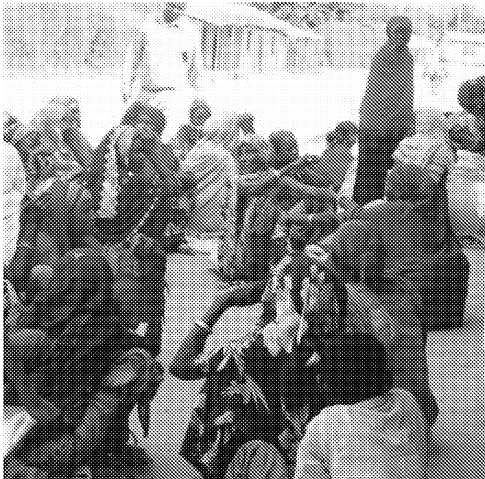
DISTRIBUZIONE ALIMENTARI ALLE FAMIGLIE