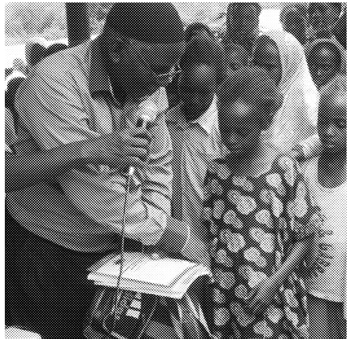
DISTRIBUZIONE MATERIALE SCOLASTICO AI MINORI

Attualmente, il PROGETTO SOLOLO sostiene in via diretta 300 MINORI ORFANI E/O VULNERABILI . 26 di questi, in parte privi di riferimenti adulti o provenienti da famiglie particolarmente indigenti, vivono oggi in tre case famiglia integrate nel villaggio di Sololo, in un quartiere denominato OBBITU CHILDREN , interamente gestito dalla controparte CIPAD. Sostiene inoltre 72 STUDENTI DELLE SCUOLE SUPERIORI; 3 UNIVERSITARI E 27 ANZIANI ; anche per questi è possibile attivare un Sostegno a Distanza. Secondo necessità effettua interventi di emergenza a favore della popolazione in genere.